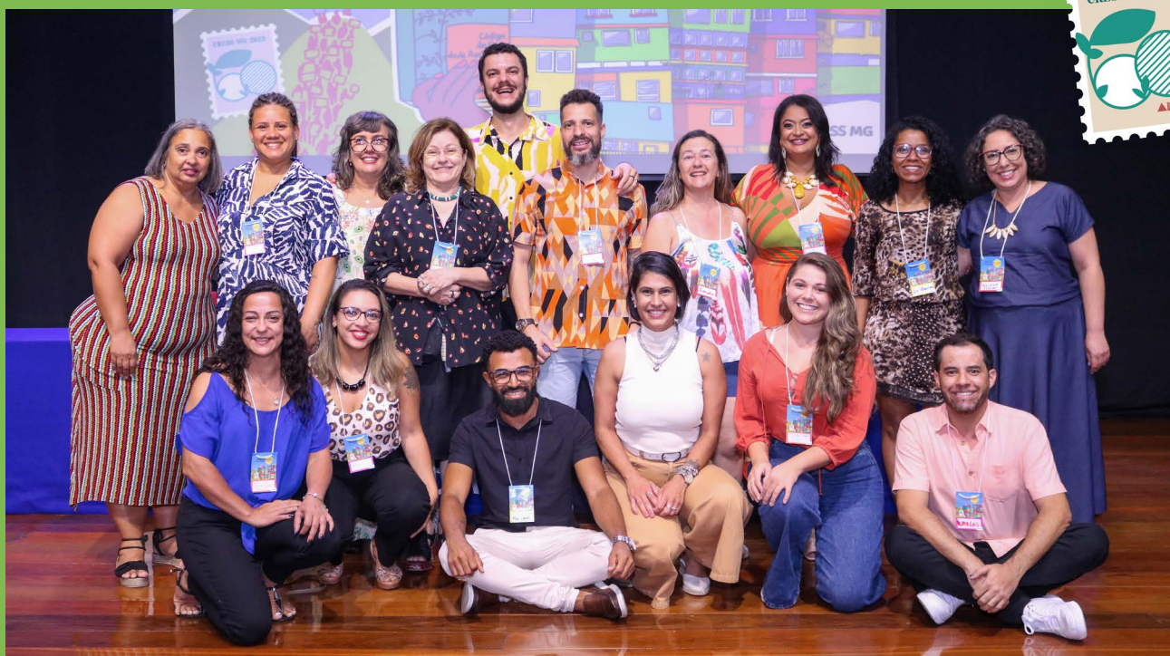
Integrantes da gestão “Lutar quando é fácil ceder”(2023-2026), durante o Seminário Estadual pelos 60 anos do CRESS-MG, realizado no dia 1º de dezembro, na PUC Minas, em Belo Horizonte-MG.

Em resposta a demandas atuais e relevantes, foram organizados dois cursos: a segunda edição do curso “O trabalho de assistentes sociais na Educação Básica” e a primeira edição do curso “A ética no cotidiano do trabalho de assistentes sociais”. No total, 492 assistentes sociais receberam o certificado de participação.